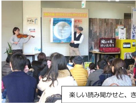
絵本読み聞かせライブ